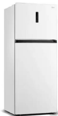
Refrigerador Duplex - Frost Free Marca MIDEA – Modelo MD RT645