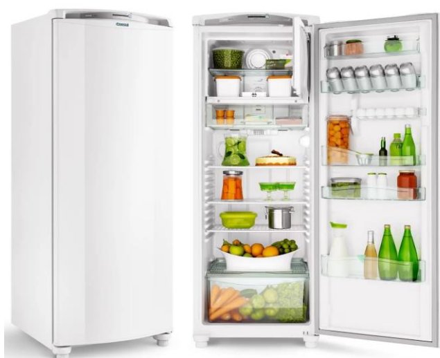
Refrigerador Doméstico – Frost Free