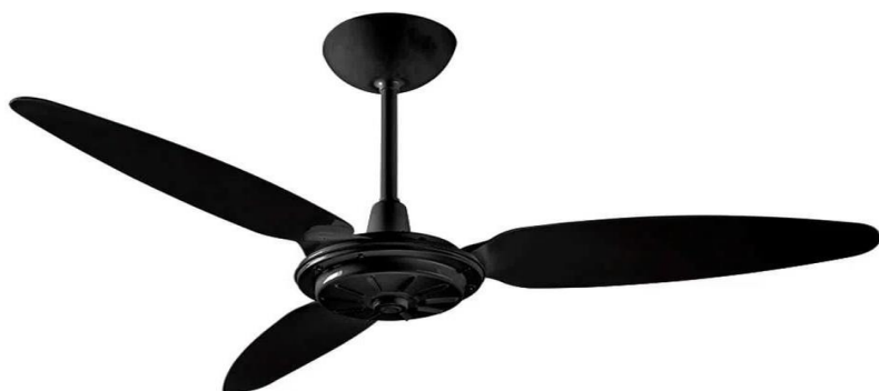
Ventilador de Teto Com 03 pás - 220V - Cor Preta

Valor Unitário: R$ 148,00 CÓDIGO: 1508210 ITEM DISPONÍVEL