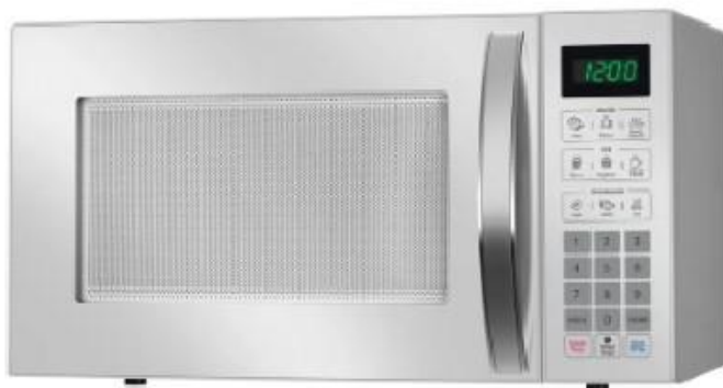
Forno de Micro-ondas Mundial 34 litros