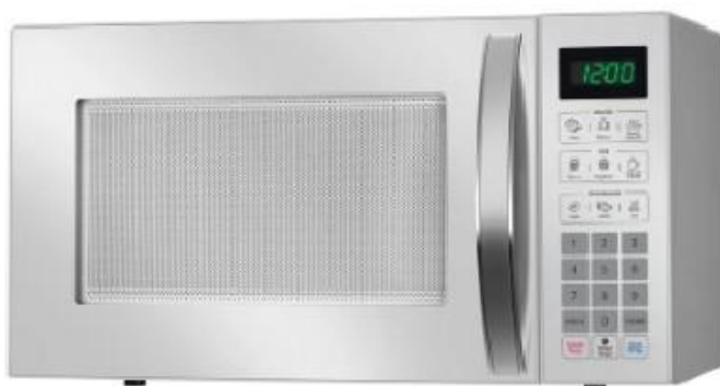
Forno de Micro-ondas Mundial 34 litros