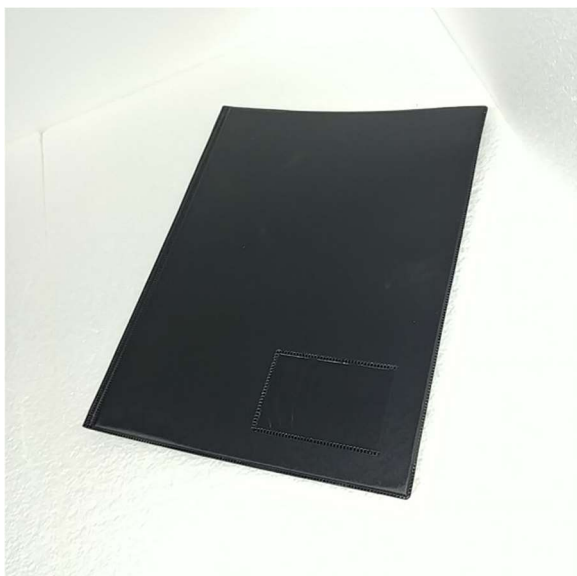
PASTA CATALOGO COM 10 PLÁSTICOS CÓDIGO: 1010102061