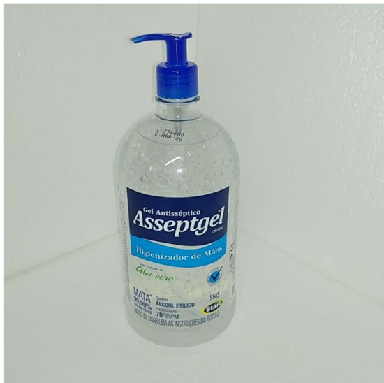
ÁLCOOL GEL COM VÁLVULA PUMP HIGIENIZADOR DE MÃOS INSTANTÂNEO CÓDIGO: 269943A