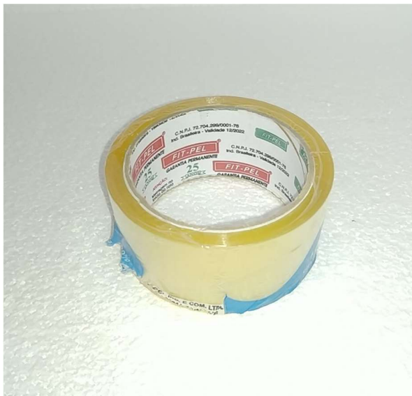
FITA ADESIVA POLIESTER 50 MM X 50 M CÓDIGO: 1010106423