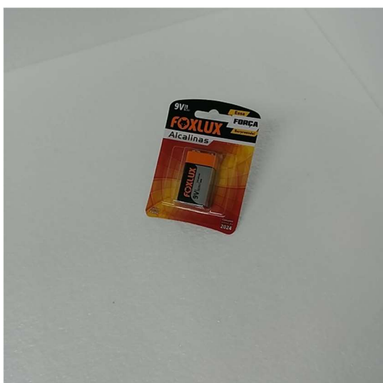
PILHA ALCALINA ALTA CAPACIDADE 9 VOLTS CÓDIGO: 1260100022