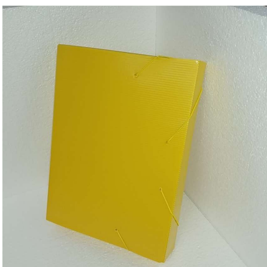
PASTA PLASTIFICADA POLIONDA 5,5 CM DORSO CÓDIGO: 1010101316