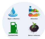
Central de Análises Químicas